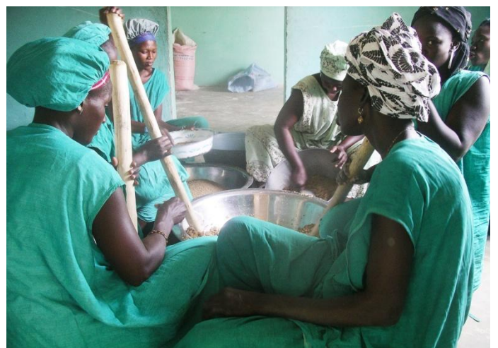
Les femmes entrain de travailler dans l'Unité de Transformation des Céréales Locales J Burner financée par Go Sénégal