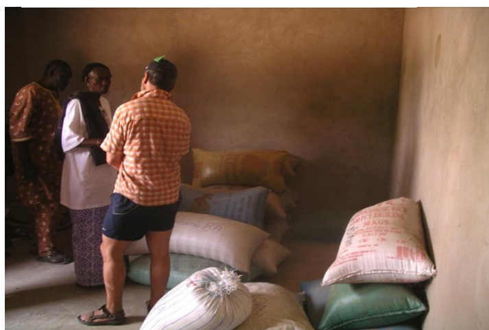
Stock de mil de la banque céréalière de Ndock Sarré