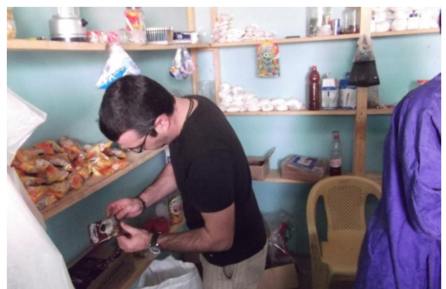
Boutique de Mbengane