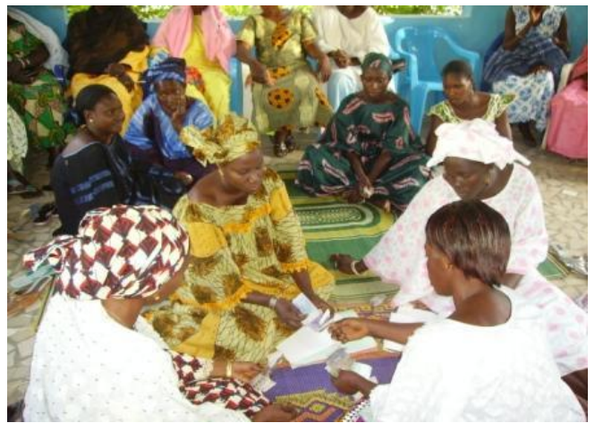
Remise de crédits aux groupements