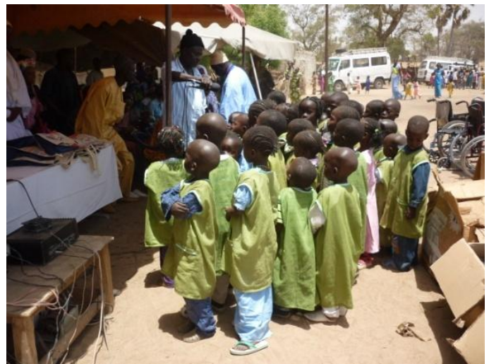
Photo de la cérémonie remise de cadeau