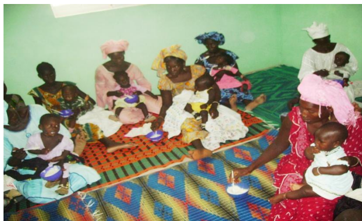
Séances de nutrition organisées à la case de santé de Mbengane