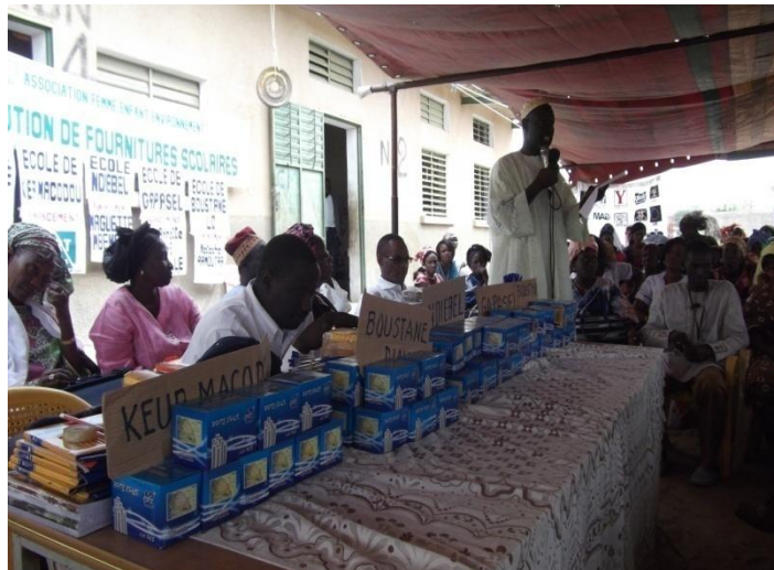
Photos de distribution de fournitures scolaires pour l'année 2010/2011

L'organisation de l'arbre de Noël de l'Espace des Tout Petits « Yandé Codou Sène de Somb n'a pas eu lieu cette année mais les enfants ont reçu leur cadeaux lors de la distribution de fournitures scolaires de l'école de Somb.