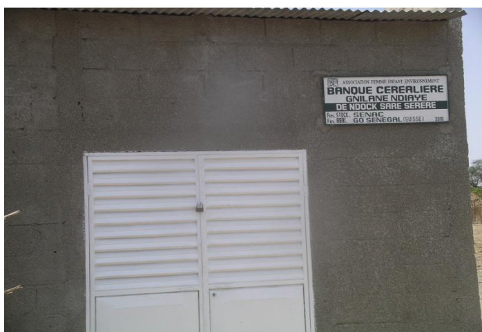
Banque céréalière de Ndock Sarré visitée par la délégation de Cayla Solidaire (Suisse)