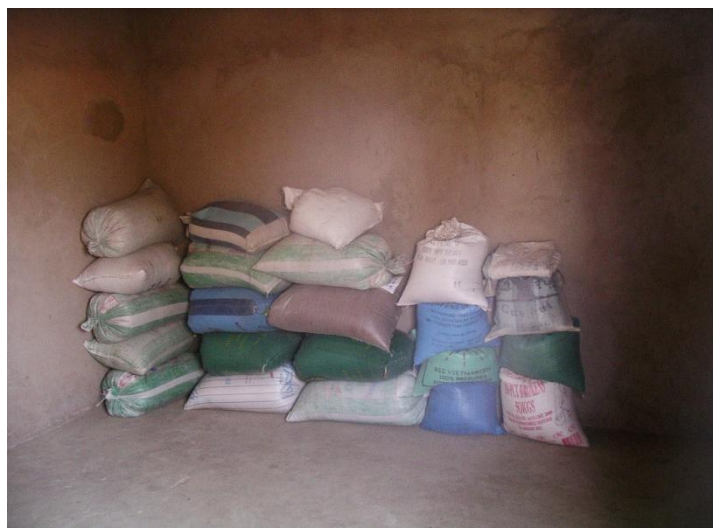
Stock de mil de la banque céréalière de Keur Ndiouga