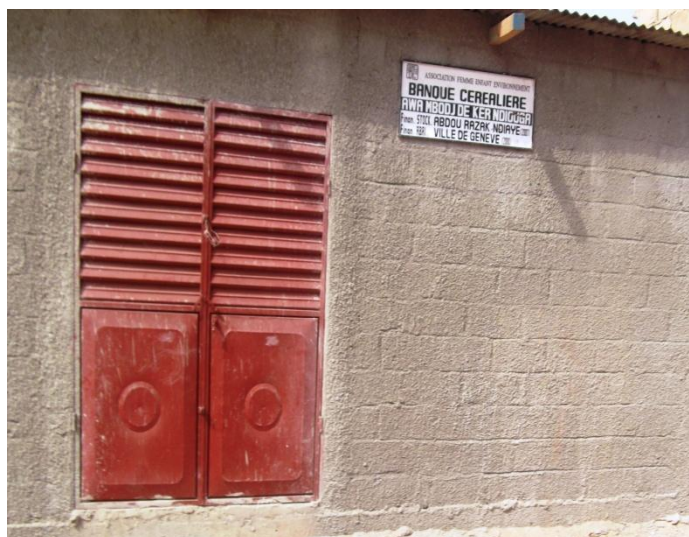
Banque céréalière de Keur Ndiouga financée par ville de Genève

En ce qui concerne le stockage, les populations sont confrontées à de nombreuses difficultés pour garder leur mil qu'elles conservent dans des cases construites en argile ; c'est pourquoi, AFEE, à la demande des populations est sur une dynamique de construction des abris pour l'ensemble des villages bénéficiaires de stock de mil pour éviter les éventuels dégâts : incendie, animaux errants, vols, souris, dégâts dus aux aléas climatiques, etc. Ainsi, AFEE a déjà construit huit(8) abris de banques céréalières grâce à ses partenaires KTCT de la Grande Bretagne, Go Sénégal Suisse, la Ville de Genève Suisse et CPAC/FMI Washington. Parmi ses huit (8) trois (3) ont été construites en 2010 à savoir les banques de Ndock saré par Go Sénégal et Somb meem et Keur Ndiouga par le Ville de Genève. Pour un retard lié au financement la banque céréalière de Bounefossow dont la construction était prévue pour l'année 2010 n'a été réalisée qu'en 2011.