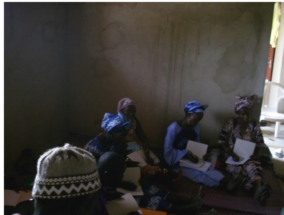
Les formateurs en séance avec les Relais de AFEE