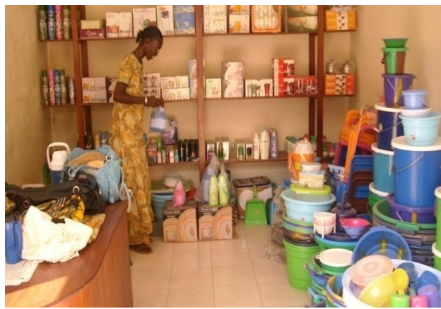
Magasin Amie Tall