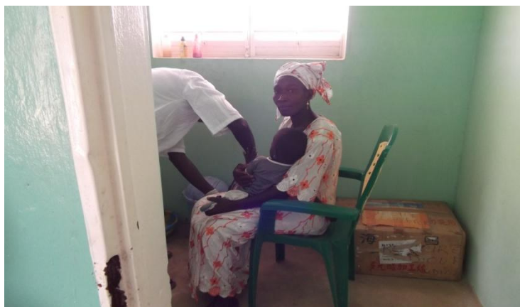
Consultation à la case de santé de Mbengane